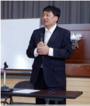
稲成小学校教育講演会